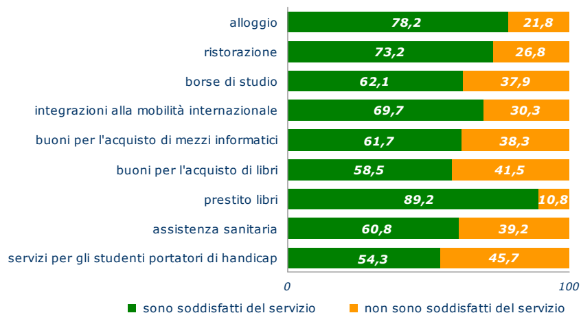
Graf. 11.2 – Laureati che hanno usufruito dei servizi per il Diritto allo Studio (%)

I laureati che nel loro percorso di studi hanno usufruito dell'alloggio sono il 4,3 per cento del totale; questa quota raggiunge il 5 per cento per gli atenei del Sud e delle Isole (Graf. 11.3).