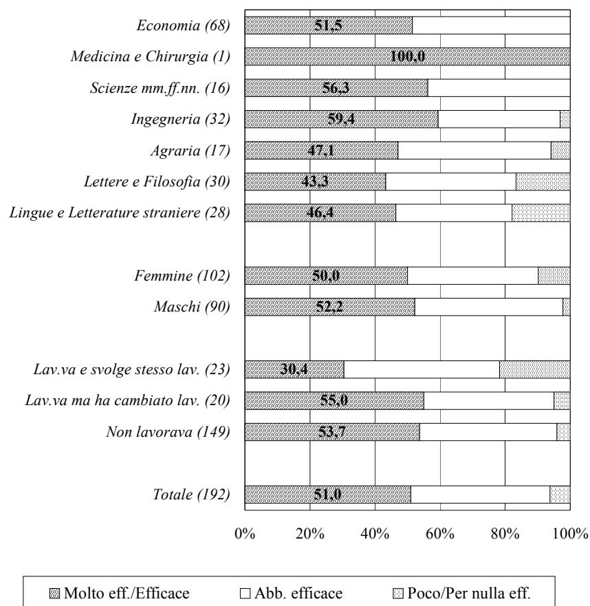
Graf. 4.1 - Occupati: efficacia esterna della laurea, per facoltà, genere e condizione occupazionale alla laurea (valori percentuali; tra parentesi: numero di intervistati che è stato possibile classificare)