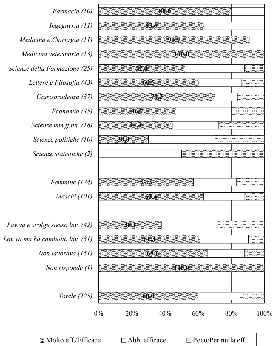
Graf. 4.1 - Occupati: efficacia esterna della laurea, per facoltà, genere e condizione occupazionale alla laurea (valori percentuali; tra parentesi: numero di intervistati che è stato possibile classificare)