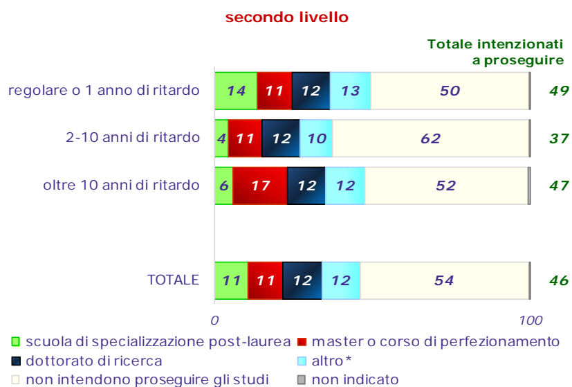
Graf. 13.3 – Laureati che intendono proseguire gli studi, per tipo di corso ed età all'immatricolazione (%)

* Altra laurea, tirocinio, diploma accademico, borsa di studio o altre attività comprese le attività non specificate.