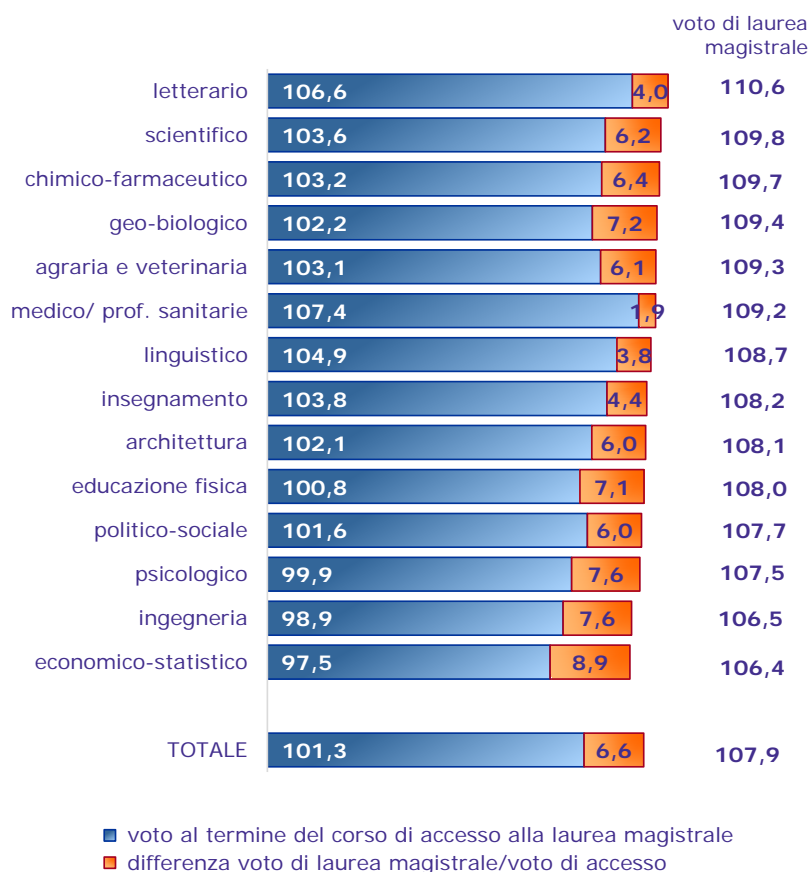
Graf. 7.3 – Voto di laurea magistrale e voto di laurea del titolo di accesso al biennio magistrale*, per gruppo disciplinare** (medie) laureati magistrali

* Per il calcolo delle medie il voto di 110 e lode è stato posto uguale a 113.